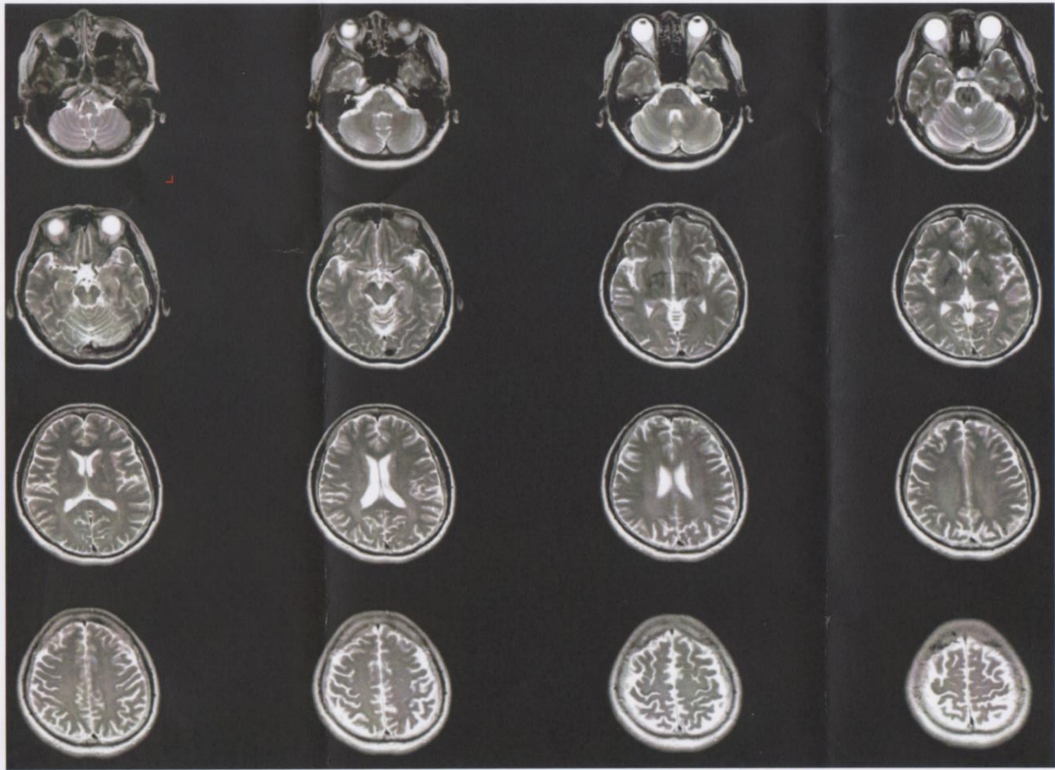
国立精神・神経医療研究センター 神経研究所 画像研究第三課